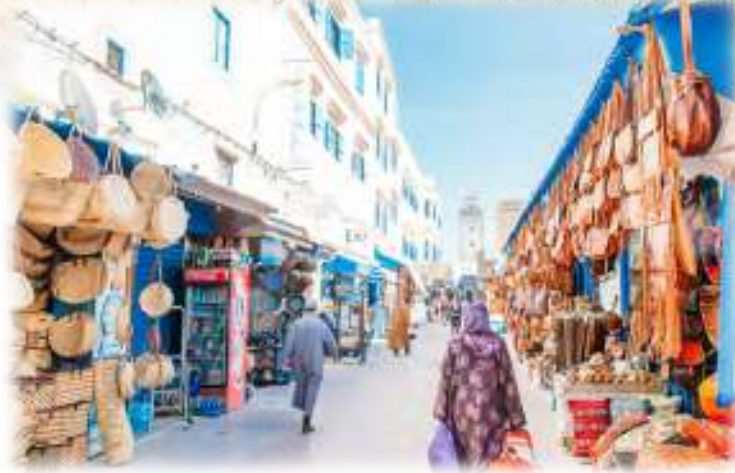
Photo : Une rue d'Essaouira

Visite organisée d'Essaouira (en option à convenir sur place)