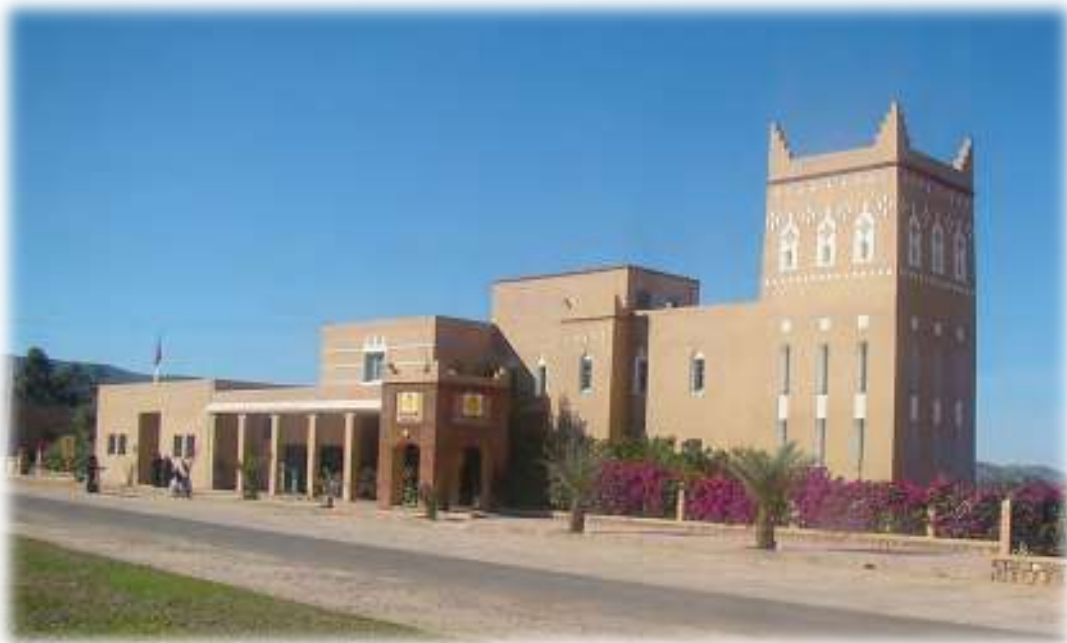
Coopérative Agricole Féminine Taitmatine, Tioute, Province de Taroudant