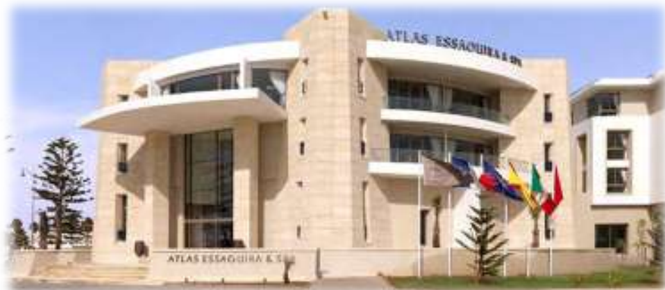
Hôtel Atlas d'Essaouira – lieu des conférences

« Le FIAB est avant tout un Forum, c'est-à-dire qu'il privilégie au maximum les échanges entre tous les participants afin que les nombreuses expériences des uns et des autres nous enrichissent mutuellement. Les présentations orales sont un moyen pour délivrer quelques expériences vécues. La sortie de terrain permet de se plonger dans un exemple concret existant sur le territoire d'accueil du FIAB. Les ateliers traitent de questions importantes auxquelles les groupes de travail apportent des réponses. Et toujours, le FIAB favorise la simplicité, la complicité et l'authenticité dans un climat d'amitié et de respect entre tous les participants. »